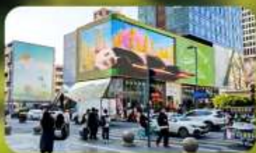
ไท่กุ๋หลี่