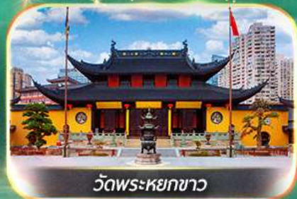
วัดพระหยกขาว

เที่ยวมหานครแห่งอนาคต ถ่ายรูปเช็คอินแลนด์มาร์คสำคัญ ช้อปปิ้งตลาดเงินหวังเมี่ยว, ถนนนานกิง, POP MART