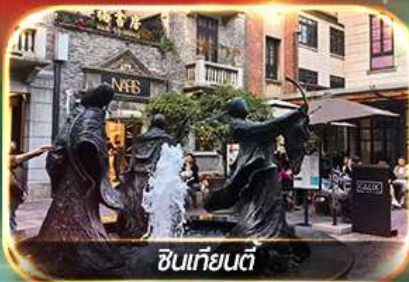
ซินเทียนตี้