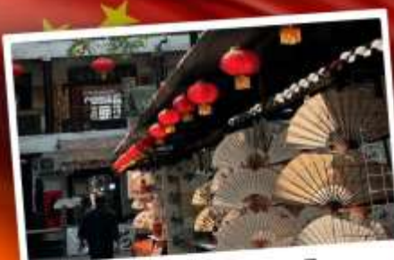
ถนนโบราณซูหยวนเหมิน

"มรดกโลกพันปี สุสานทหารดินเผา" แต่งชุดจีนโบราณ เดินถนนวัฒนธรรมต้าถิง