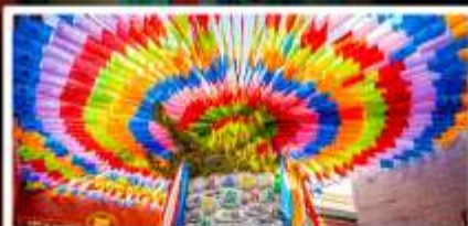
วัดลามะกว้างเหิน