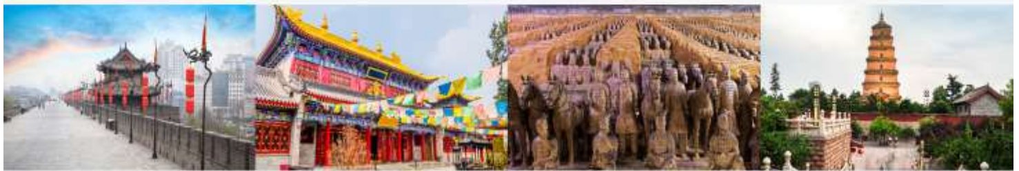
กำแพงเมืองโบราณ วัดลามะ สุสานทหารจีนซี เจดีย์ห่านป่าใหญ่